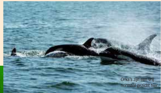
Orka's zijn een vrij normaal gezicht hier.