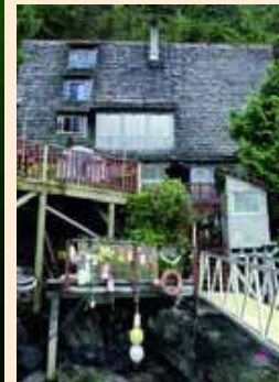
Het stulpje van het Nederlands-Canadese duikcặpaar.